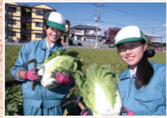
兵庫県立有馬高等学校

大正12年創立。平成10年総合学科改編に伴い、淡路農業高等学校から改称。4つの系列を設置し、「人間愛（防災と福祉の心）」「自然愛（環境を守る心）」「社会愛（社会に貢献する心）」を育てます。