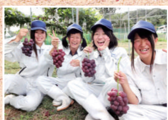
兵庫県立佐用高等学校

校訓「汗をいとわず、命を尊び、日々高きを志す」のもと、地元で愛される学校として日々頑張っています。農業科のシクラメンや果樹、畜産科の但馬牛や但馬どり、生活科のたじまん（肉まん）や園芸デザイン作品などが有名で、地域の方々にも大好評です。