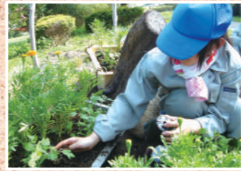
兵庫県立淡路高等学校

大正12年創立。平成10年総合学科改編に伴い、淡路農業高等学校から改称。4つの系列を設置し、「人間愛（防災と福祉の心）」「自然愛（環境を守る心）」「社会愛（社会に貢献する心）」を育てます。