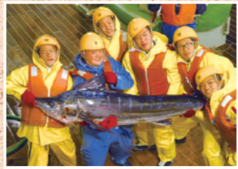
兵庫県立香住高等学校

県農は7学科を擁する全国でも最大規模の農業高校です。「食と環境のスペシャリスト」をめざして、勉強も実習も部活動もぜんぶ本気で取り組んでいます。また交流・貢献事業で地域の皆さんとともに活動しています。