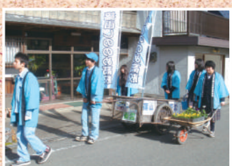
兵庫県立篠山東雲高等学校

創立106年の歴史と伝統。「明るくいいきき、夢を育む 佐用高校」をスローガンに、夢を育み、志を抱き、地域社会や国際社会に貢献できるこころ豊かな人材育成を行う総合制（農業科学科、家政科、普通科）の学校です。