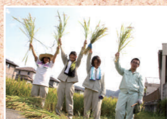
兵庫県立上郡高等学校

本校は、兵庫県最西端の上郡町にある学校で、今年で創立110年の歴史を迎えます。普通科と専門科（農業科・園芸科・農業土木科）からなる総合制高校で、校訓「愛と誠」のもと、安心・安全で地域に信頼され愛される学校を目指しています。