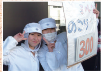
兵庫県立農業高等学校

生活科では、「種まきから食卓まで」をキャッチフレーズに「農の創造」と「食の創造」を学習しています。私たちが農場の実習で育てた野菜や手作りの加工品は好評です。