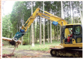
兵庫県立山崎高等学校

有馬高校『人と自然科』は平成12年に設立され、『楽しむ育てる創る』をキーワードに、土に親しみ自然と共生し地球にやさしい環境を創るという新しいタイプの農業教育を目指し、生徒はいきいきと学習に励んでいます。