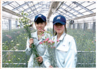
兵庫県立播磨農業高等学校

山崎高等学校森林環境科学科では、森林環境や木材の利用などについて学習します。実習や見学などの体験を通じて知識や技術を習得します。佐用町船越に80haの演習林があり、宿泊実習に活用されています。