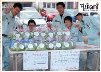
兵庫県立氷上高等学校

香住高校海洋科学科は兵庫県唯一の水産を学べる学科です。2ヶ月におよぶ漁業航海実習、プロの調理師による調理実習、様々な魚の加工実習、ダイビング実習など様々な実習体験を行っています。これらの実習を通じて水産業で必要な知識や技術を身につけます。