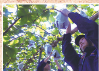
兵庫県立但馬農業高等学校

本校は、兵庫県最西端の上郡町にある学校で、今年で創立110年の歴史を迎えます。普通科と専門科（農業科・園芸科・農業土木科）からなる総合制高校で、校訓「愛と誠」のもと、安心・安全で地域に信頼され愛される学校を目指しています。