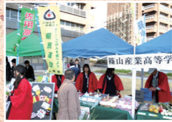
兵庫県立篠山産業高等学校

篠山東雲高校は、京都府や大阪府との県境で街道のまち福住にあります。一学年一クラスの全学年3クラスの小さな農業高校です。篠山の特産物「山の芋」や「丹波黒大豆」の栽培・加工をはじめ犬の飼育も行っています。