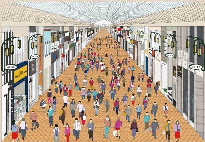
元町1番街商店街（1丁目）